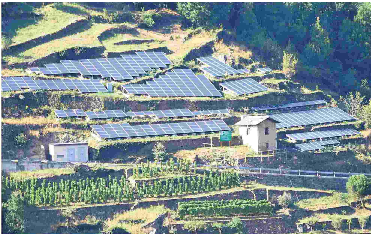
Molti paesaggi italiani sono il frutto di uno stretto e secolare legame tra natura e cultura, ma oggi la loro tutela appare sempre più spesso a rischio