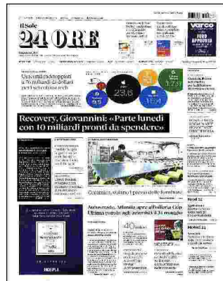
Infrastrutture e mobilità sostenibili. Il ministro Enrico Giovannini