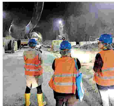
▲ Cantieri I lavori della Galleria di base del Brennero

Nato a Fuggi nel 1962, è amministratore di Ferrovie dal luglio 2018