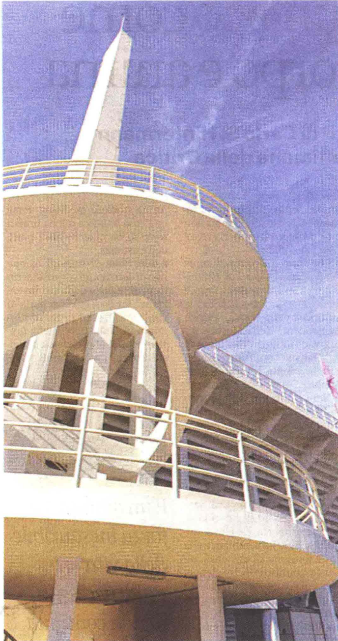
Le scale elicoidali dello stadio Artemio Franchi di Pier Luigi Nervi