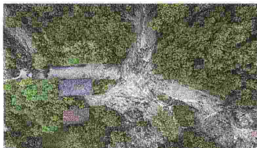
Monterenzio La frana a ridosso delle abitazioni

La frana minaccia lo storico borgo degli artisti