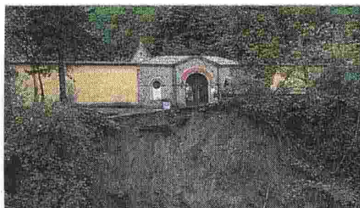
Castel Del Rio La frana sotto il cimitero