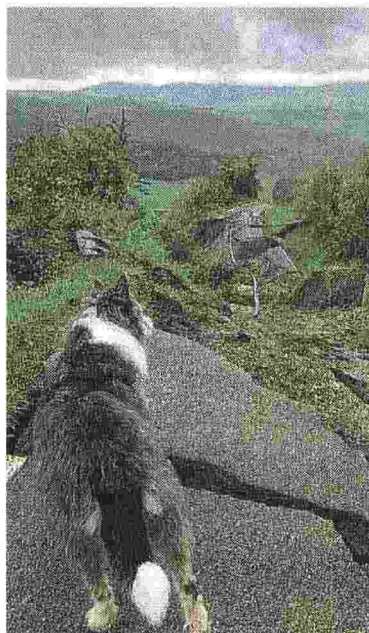
Colli imolesi