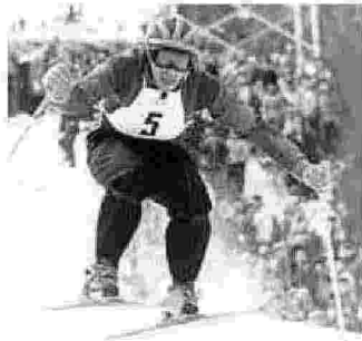
Zeno Colò, nativo dell'Abetone

L'Abetone lega il suo nome al grande Zeno Colò che, lasciato le gare, diventò maestro di sci nella località sciistica appenninica. Si impegnò per la promozione e lo sviluppo della stazione, favorendo la fondazione della Società Funivie Abetone e contribuendo alla creazione della prima ovovia. Disegnando, infine, le tre piste che oggi portano il suo nome.