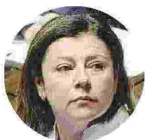
PAOLA DE MICHELI

• La bozza del decreto è stata studiata a Palazzo Chigi