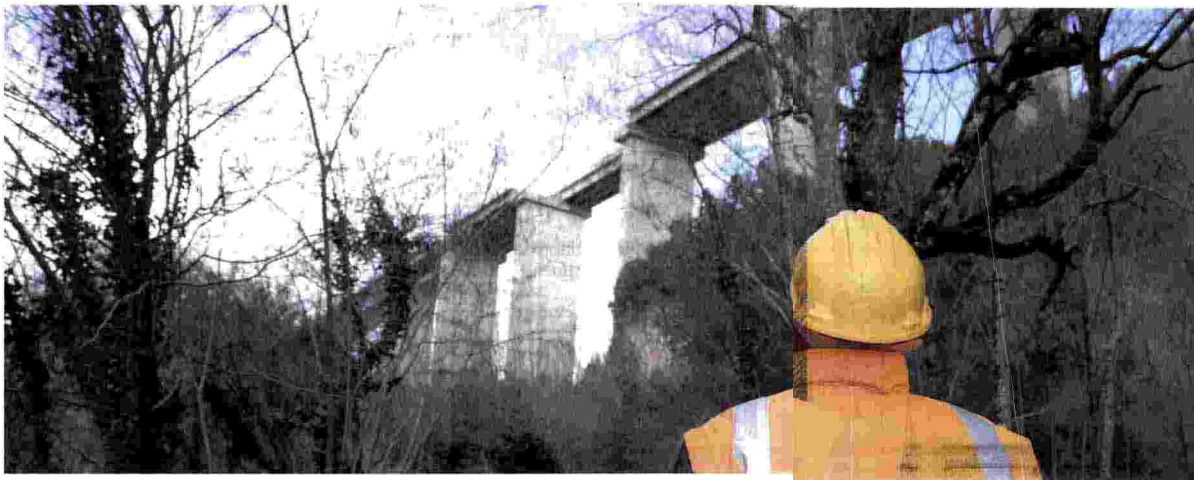
Un operaio osserva un viadotto crollato e abbandonato all'incuria.

La ministra dello Sviluppo, Federica Guidi, ha «apprezzato» il dissequestro del cantiere Fincantieri di Monfalcone con «norme riviste sullo smaltimento rifiuti».