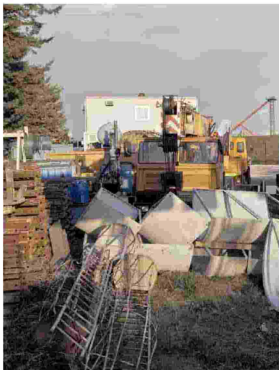
A Tor Vergata, nella Cittadella dello sport-Roma, prevista per i mondiali di nuoto cresce l'erba