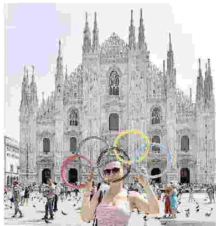
Milano conserva gran parte del suo piano