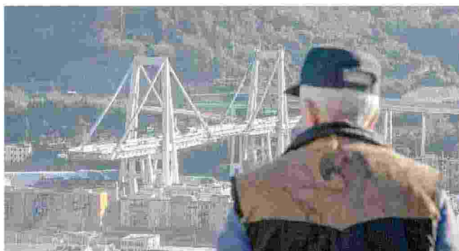
Genova, una veduta di ponte Morandi, crollato il 14 agosto scorso