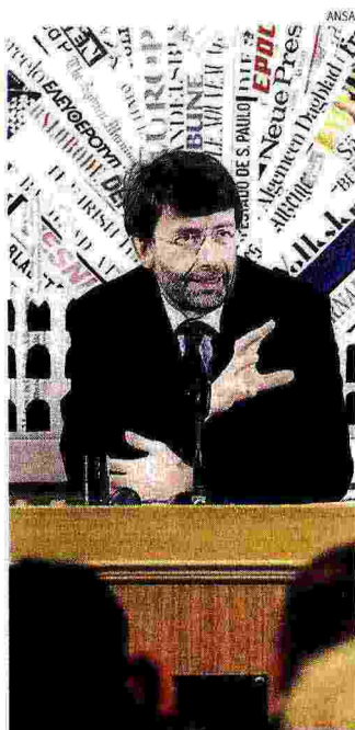
Ministro. Dario Franceschini

Risultati incoraggianti, ma ancora lontani dalle potenzialità di un'accorta valorizzazione del patrimonio. Per questo, secondo Franceschini, occorre migliorare le capacità di promozione e "vendita" delle opere esposte nei musei: «Il che non significa non fare mostre estemporanee. Occorre, però, puntare soprattutto su quanto i nostri luoghi d'arte già espongono».