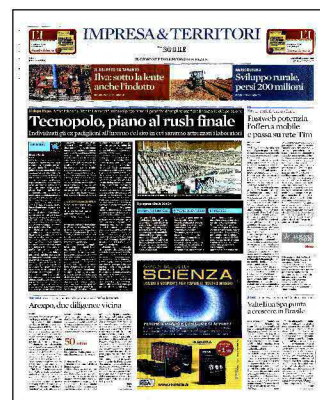
Un'area in cerca di vocazione. Un'immagine del sito che ha ospitato l'esposizione universale