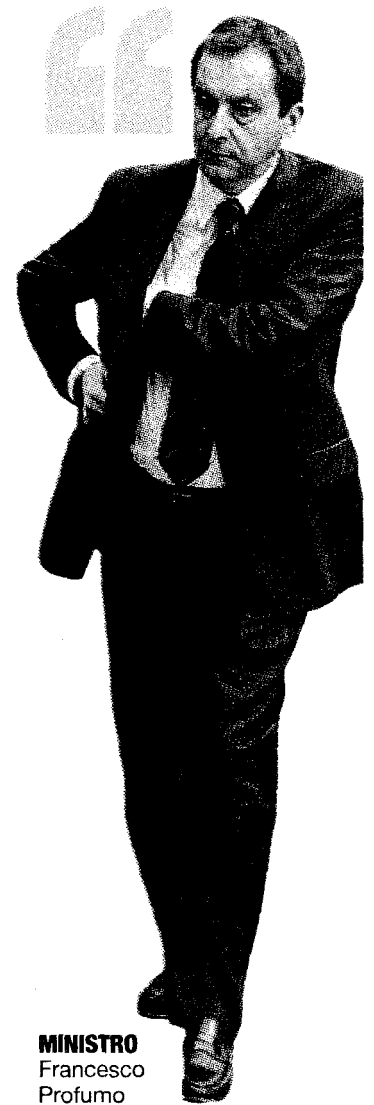
MINISTRO Francesco Profumo