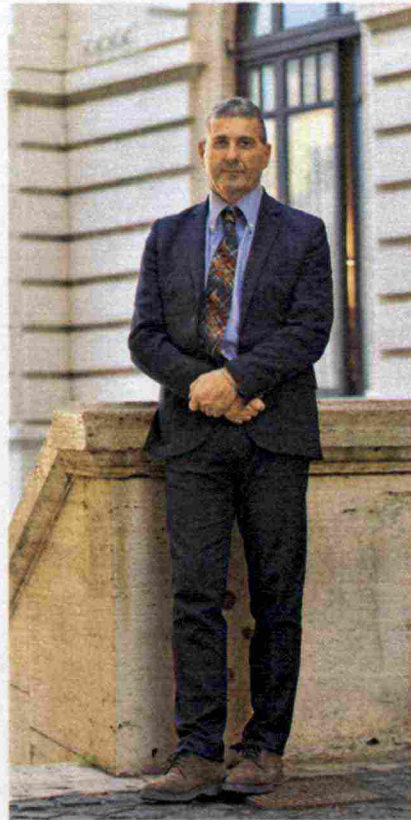
Piero Farabollini è il commissario straordinario del governo per la ricostruzione dall'ottobre 2018.

Situazione di stallo anche per la ricostruzione privata. Per velocizzare le procedure, il decreto