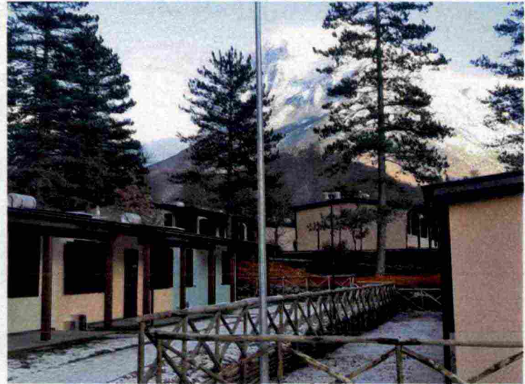
I «moduli abitativi per l'emergenza» nel comune marchigiano di Ussita.

A settembre 2016, dopo la scossa che ha spianato Amatrice , nell'Ordinanza 391 del capo della Protezione civile, le macerie erano assimilate ai rifiuti urbani e la loro rimozione e trasporto era affidata alle aziende che li gestiscono nelle zone interessate. Nelle Marche, la gestione dei materiali provenienti dai crolli è stata affidata a due aziende: la Cosmari per Macerata e la PicenAmbiente per i territori di Fermo e Ascoli Piceno. Il trattamento, secondo il piano macerie regionale, comprende ben sette complessi passaggi che dipendono a loro volta dall'ordine di demolizione, anch'esso sottoposto a una lunga procedura. Questo il percorso che somiglia a una via crucis: prima cernita manuale, in loco, per bonificare tracce di amianto; recupero di frammenti che possano avere rilevanza storica o artistica (con l'aiuto del ministero per i Beni e le attività culturali e delle Soprintendenze) e di ogget-