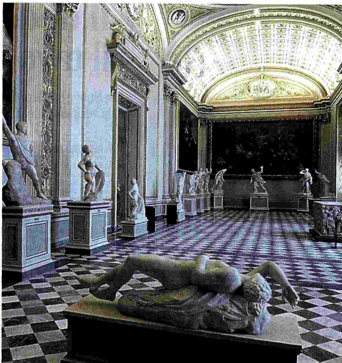
La Sala della Niobe nella Galleria degli Uffizi di Firenze