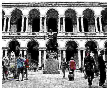
La pinacoteca di Brera