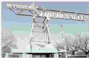
all'interno L'ingresso di Tor di Valle

Su Tor di Valle il Ministero dei Trasporti vuole vederci chiaro. In particolare su viabilità e ponti. Dopo l'inchiesta della Procura e gli arresti di giugno, il dicastero ha deciso di dare vita a un tavolo tecnico per riesaminare le opere pubbliche con i tecnici comunali.