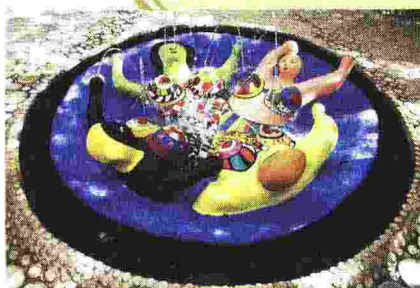
Fontana nel giardino dei Tarocchi di Niki de Saint Phalle a Capalbio (Grosseto)