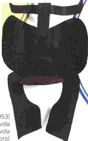
Antenata (1953) di Costantino Nivola Museo Nivola Orani (Nuoro)

LOMBARDIA Museo del Design 1880-1980 (Milano) Fondazione Achille Castiglioni (Milano - fondazione) Fondazione Vico Magistretti (Milano - fondazione)