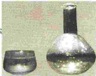
Coppetta e bottiglia-balsamario Oggetti in vetro soffiato, entrambi del I sec. d.C. Museo Archeologico Regionale (Aosta)

* Rete dei musei archeologici delle province di Brescia, Cremona e Mantova Area capitolina e Museo della città, Santa Giulia – Brescia