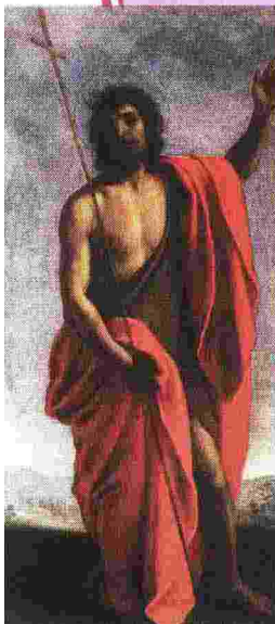
San Giovanni Battista (1626) di Zanobi Rosi Museo Masaccio Pieve di Cascia a Reggello (Firenze)