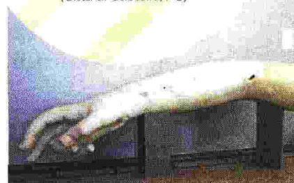
Statua colossale di divinità femminile: braccio destro, scultura 101 a.C. Museo Comunale Centrale Montemartini (Roma)

CALABRIA Museo Civico Rende e Pinacoteca (Rende, CS) LIGURIA Museo civico Amedeo Lia (La Spezia) PUGLIA Pinacoteca Corrado Giaquinto di Bari (Bari) SARDEGNA MUS'A Museo Sassari Arte (Sassari) UMBRIA Museo del Duomo (Città di Castello, PG)