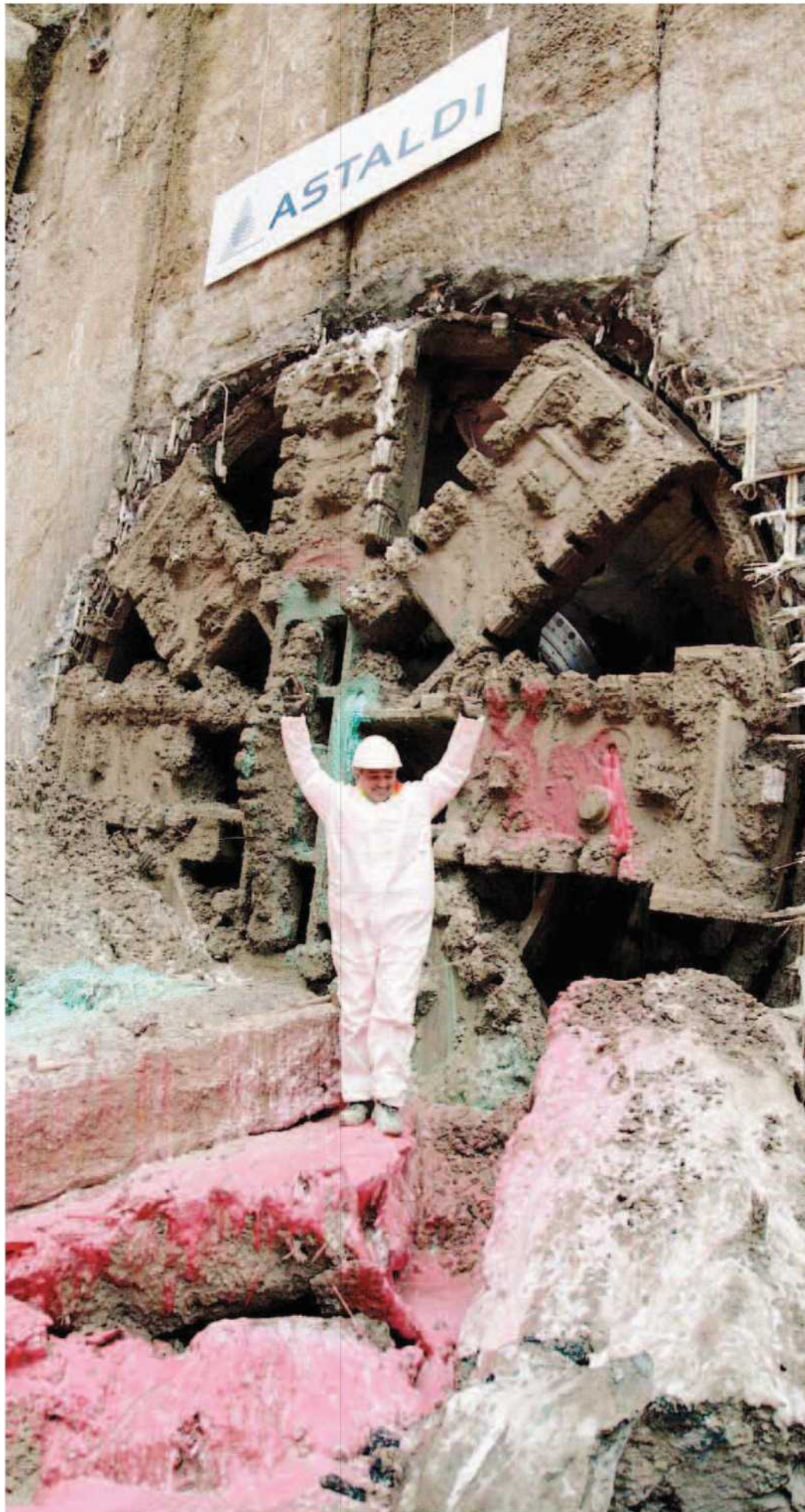
LA TALPA Il tunnel per la nuova linea Lilla arriva a San Siro: ieri la gigantesca macchina meccanica ha bucato l'ultimo diaframma del secondo tratto della M5