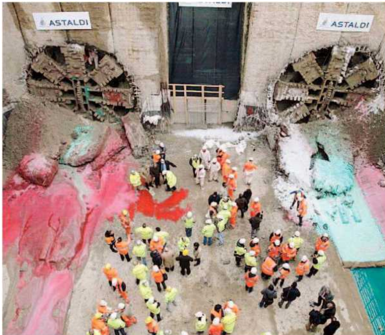
Le "talpe" della M5 si sono incontrate ieri nel cantiere di Citylife