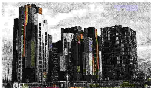
Le torri Le sette torri di housing sociale (su 11 previste) già costruite e temporaneamente adibite all'Expo Village