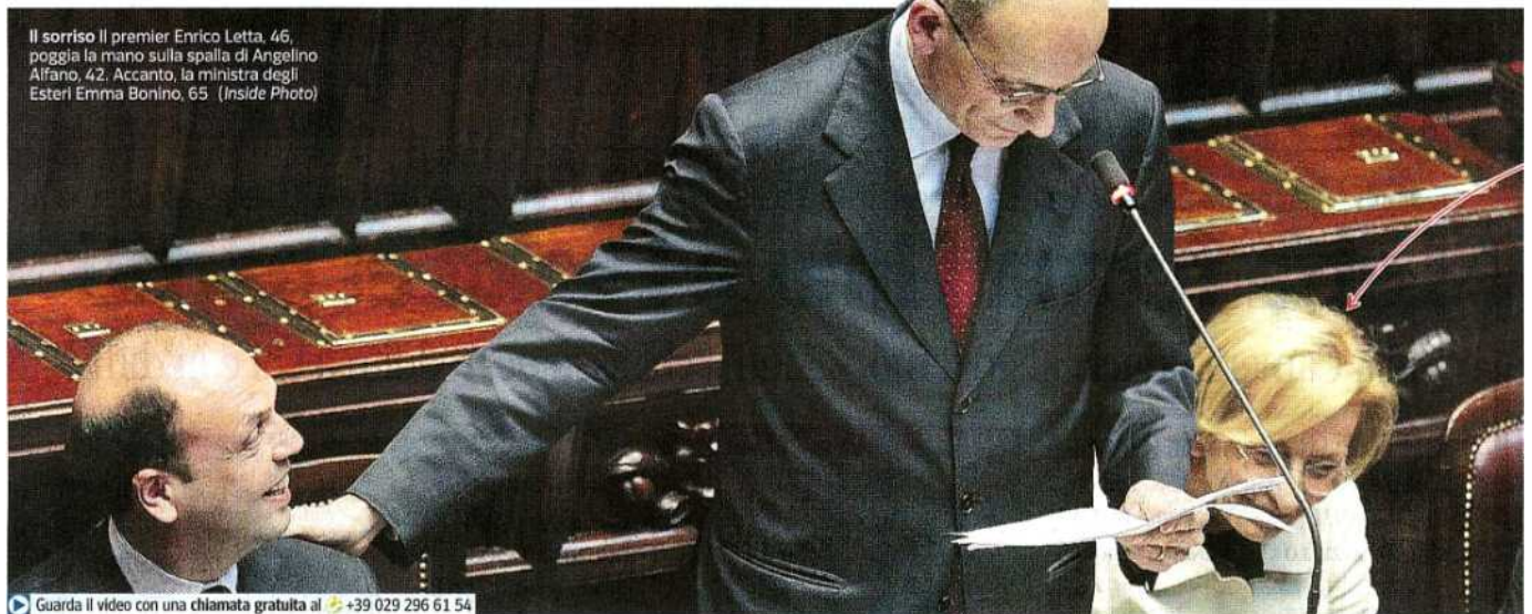
Il sorriso Il premier Enrico Letta, 46, poggia la mano sulla spalla di Angelino Alfano, 42. Accanto, la ministra degli Esteri Emma Bonino, 65.

Cesare Beccaria Sempre Enrico Letta ha ricordato, parlando dell'emergenza carceri e giustizia, che l'Italia è il paese di Cesare Beccaria, giurista e filosofo italiano, autore del testo «Dei delitti e delle pene»