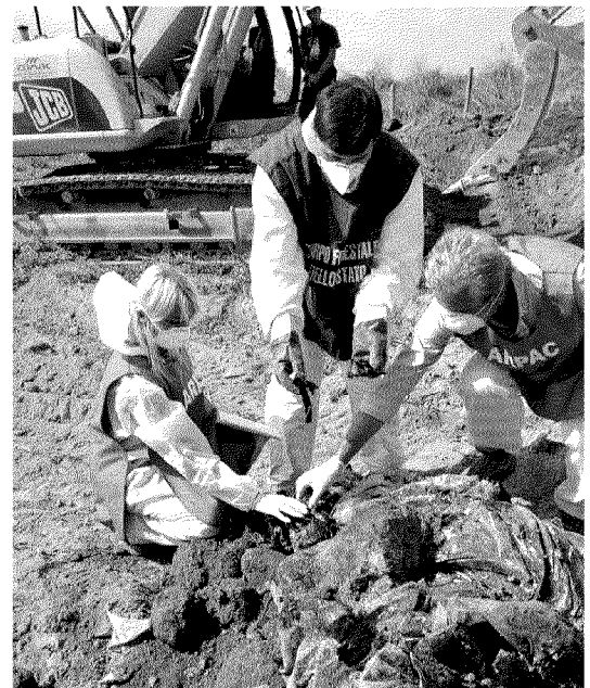
Tecnici al lavoro su terreno avvelenato da rifiuti tossici