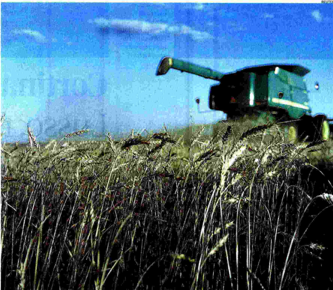
Agricoltura in pericolo. Un momento del raccolto di grano nella campagna del Nebraska

Nota: Per il 2050 la previsione è sulla base dello scenario medio sul cambiamento climatico; Fonte: ipcc , Gruppo intergov. sul cambiame. climatico