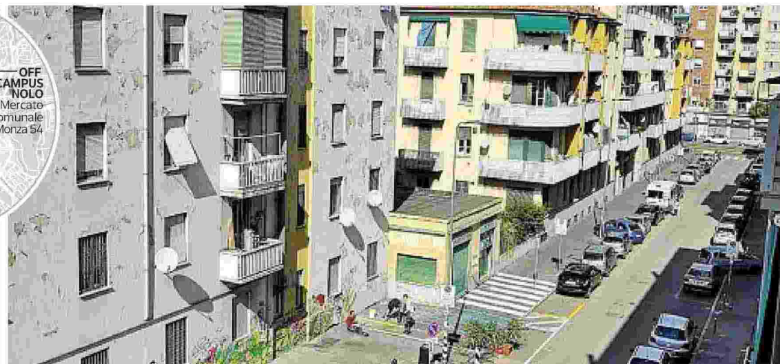
Università Il Politecnico apre un laboratorio nelle case Aler del quartiere di San Siro, e lancia nuovi progetti. Sopra la sistemazione di via Abbiati