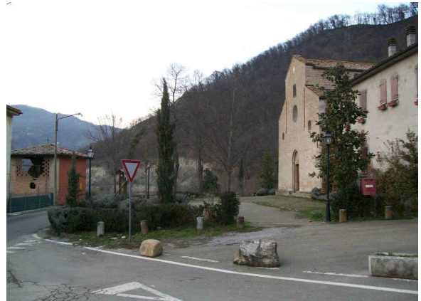
S.Lorenzo e il fabbricato da riutilizzare (sulla sinistra)