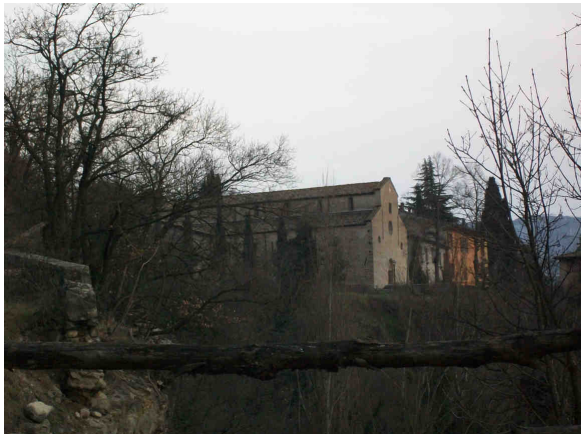
S.Lorenzo, vista dalla strada