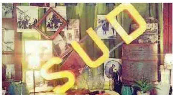
Una delle immagini usate dal gruppo «Bentornati al Sud»