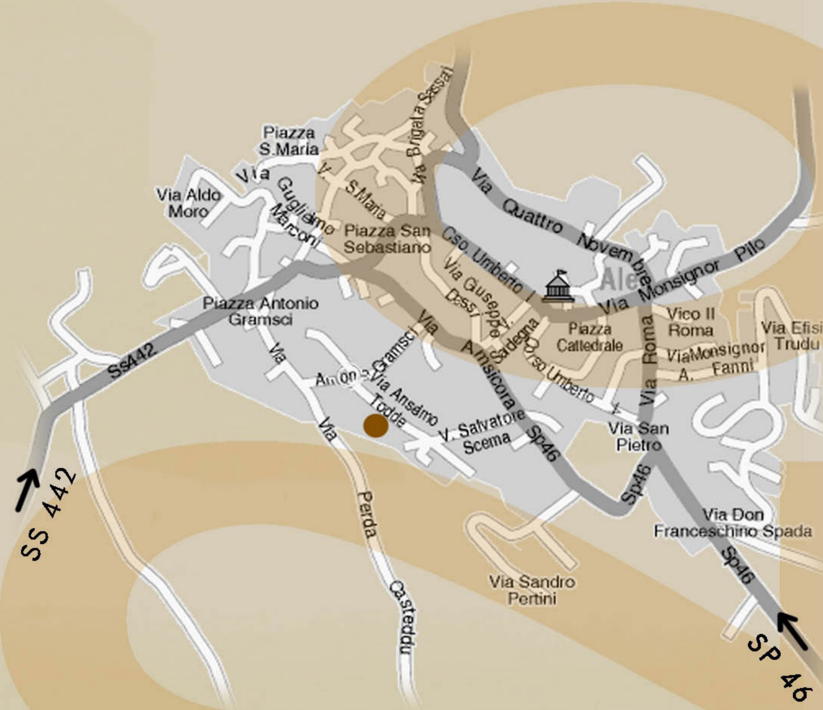
COME ARRIVARE ALLA SEDE DELLA 17° COMUNITA' MONTANA

COMUNE DI ALES (OR) - SEDE DELLA 17° COMUNITA' MONTANA