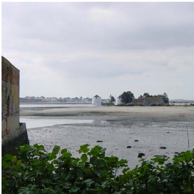
2, 3- Lisboa: Piazza Metropolitana — Tago, 2005, fotografia Sofia Morgado