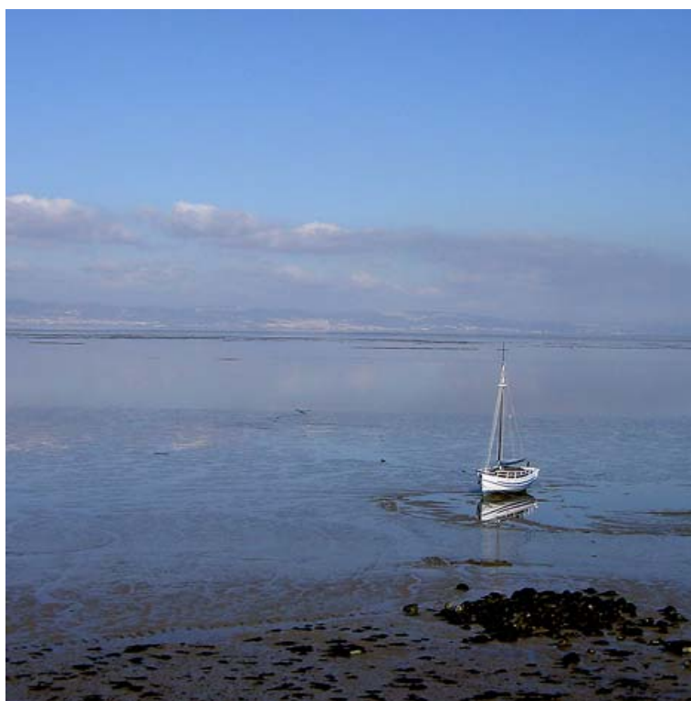
1- Lisbona: Piazza Metropolitana — Tago, 2005, fotografia Sofia Morgado.

Departamento de Urbanismo - Faculdade de Arquitectura - Universidade Técnica de Lisboa Pólo Universitário do Alto da Ajuda, Rua Sá Nogueira, 1349-055 Lisboa, Portugal