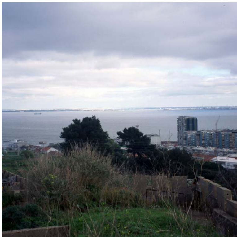
5, 6- Lisboa: Piazza Metropolitana — Tejo, 2005.