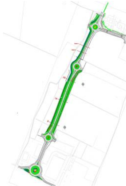
Immagine: planimetria del sistema del verde della strada