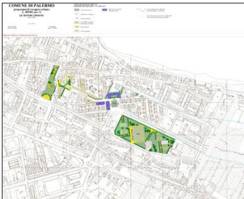
PRU ambito Sperone