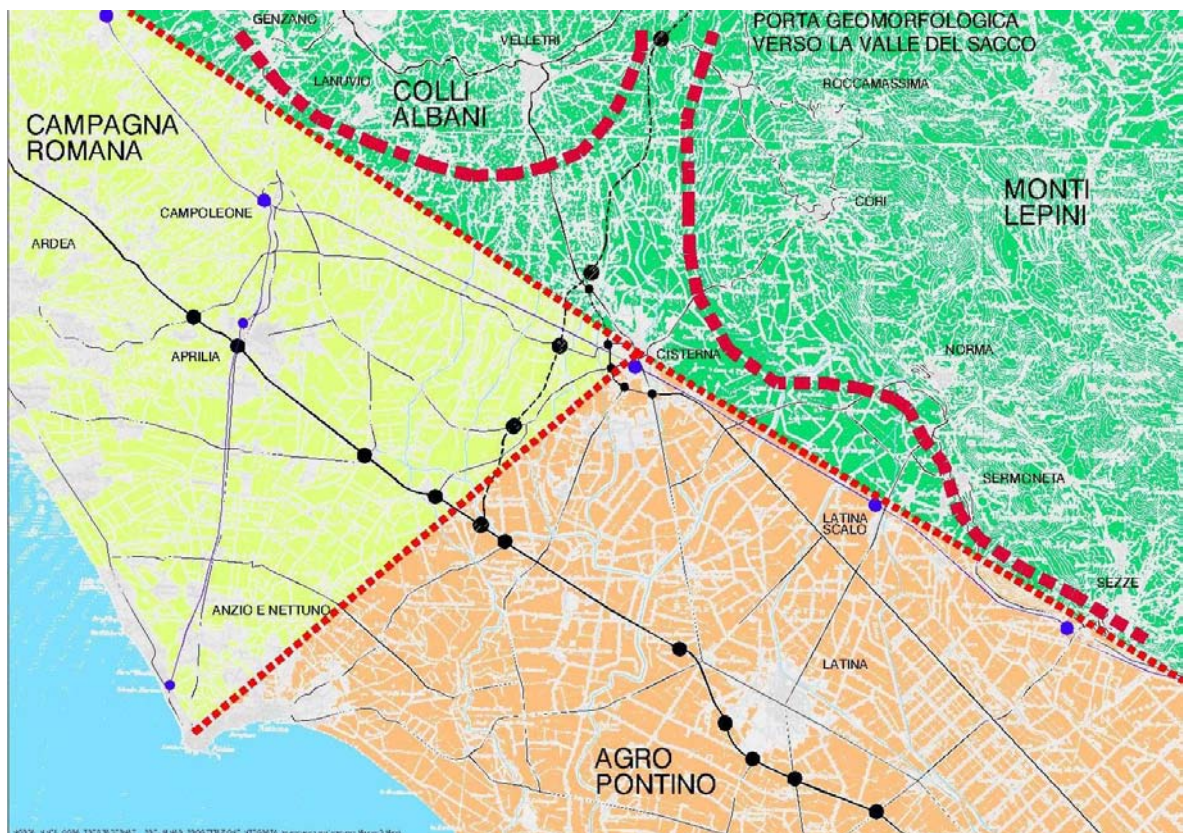
Fig. 1 – Cisterna di Latina “territorio snodo” – schema su base cartografica 1:100.000

La marca di confine che contraddistingue questo contesto geografico, che si manifesta anche nel sottosuolo dove la falda idrica appartenente al complesso idrogeologico del sistema vulcanico laziale entra in contatto con quella di tipo carsico del complesso idrogeologico dei Monti Lepini, si riflette anche nei processi insediativi e di infrastrutturazione che hanno caratterizzato l’evoluzione delle sue geografie storiche, nel tempo sia pre sia post bonifica.