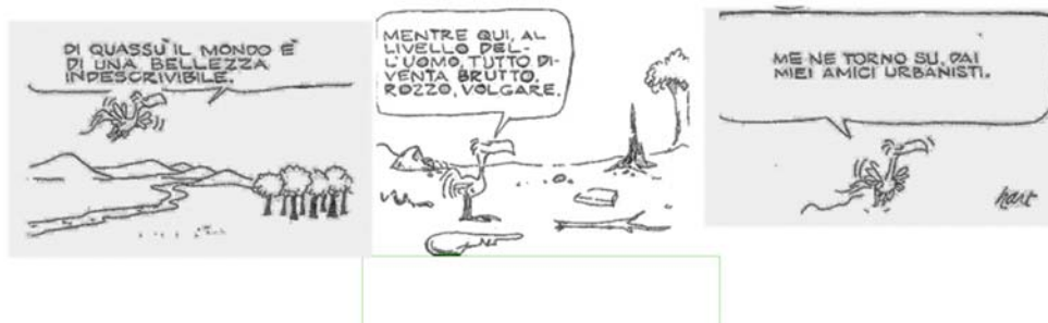
Figura 1 - Una striscia di Hart che sottolinea ironicamente la distanza fra la visione urbanistica e la realtà territoriale

L'incapacità di prender parte, o se si vuole, l'allontanamento del cittadino dalla partecipazione nella scelta pubblica va analizzato non solo nelle sue espressioni e manifestazioni di superficie ma considerato nelle sue radici profonde e nelle sue motivazioni più intime che, come questo paper tenta di mostrare, possono ricondursi non solamente ad una diffusa sfiducia verso l'élite amministrativa ma anche ad un preoccupante fenomeno di disgregazione endogena della collettività e di perdita del capitale sociale urbano.