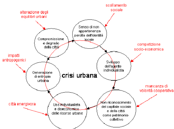
Figura 3 - Schema delle relazioni che determinano la crisi urbana

l'interpretazione della complessità urbana che, con diverse accezioni, adattamenti ed evoluzioni, sembra in grado di consentire efficaci analisi studi e proposizioni di procedure di governo della trasformazione urbana e territoriale. Da tale approccio sono derivate interessanti riflessioni e nuove proposizioni di modelli di assetto urbano quale quello frattale proposto Batty e Longman.