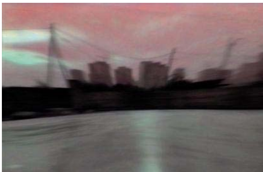
Bianco-Valente & Mass, Area, Video (special project for n.est), 3'19", 2004

Su di un livello più microscopico di indagine, analizzando le peculiari categorie spaziali di Ponticelli, si sperimentano fenomeni di dis-percezione, interpretabili solo nella prospettiva neurofisiologica della teoria sulle mappe corporee di Damasio. Fenomeni che esprimono la biunivoca interazione tra corpi e ambienti, dimostrando come il paesaggio non sia affatto indifferente, per dirla con Pietro Valle. Vissuti dispercettivi - ormai stratificati negli abitanti del quartiere di Ponticelli e, certo ancor più, in quello specificatamente post-industriale di San Giovanni a Teduccio - talmente complessi da imporre letture multidisciplinari che siano aperte anche alle discipline artistiche 1 . Fenomeni, quelli della dispercezione, la cui rappresentazione viene tentata attraverso il lavoro del duo Bianco - Valente e Christian Leperino, artisti che hanno apportato contributi imprescindibili alla presente ricerca 2 . Contributo artistico che prova a narrare gli stati di dis-percezione che caratterizzano la periferia orientale di Napoli, soprattutto in quello che può essere il tentativo di elaborazione (o di non-elaborazione) delle connesse condizioni di illusione psicosensoriale.