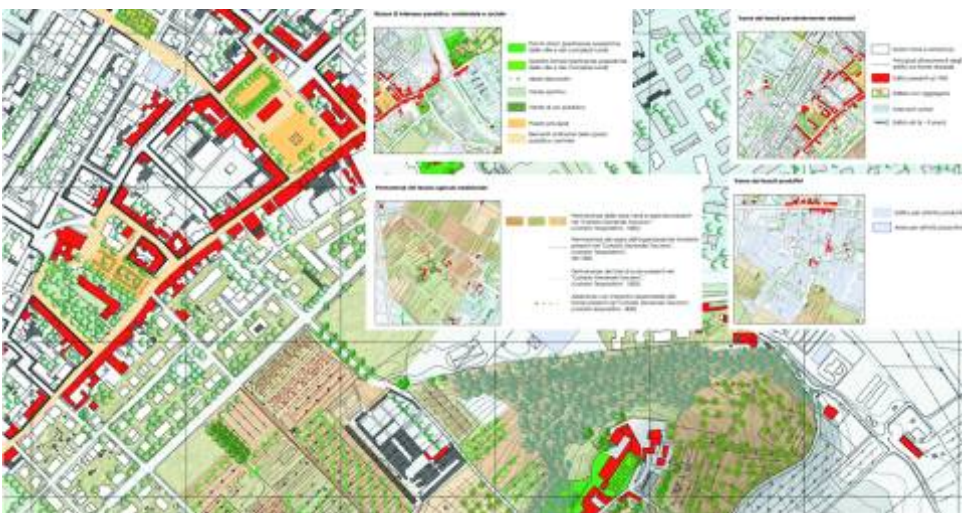
Fig. 3 - Patrimonio urbano - Scandicci