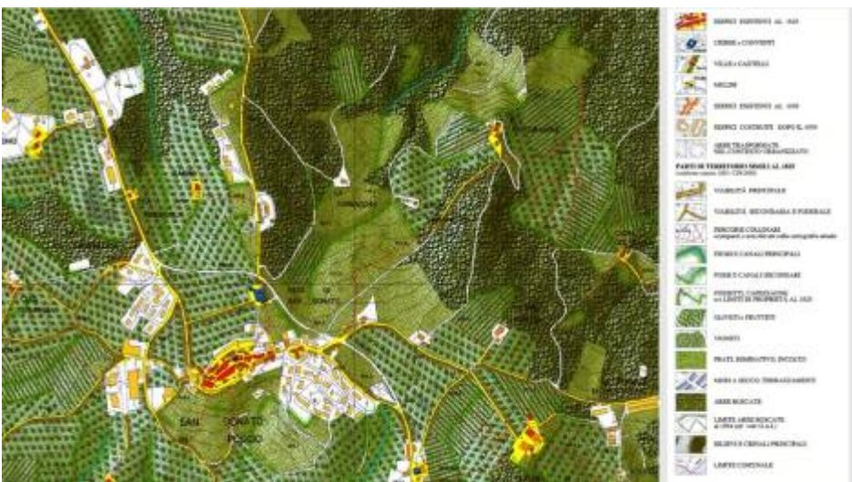
Fig. 2 - Articolazioni territoriali - Tavarnelle val di Pesa