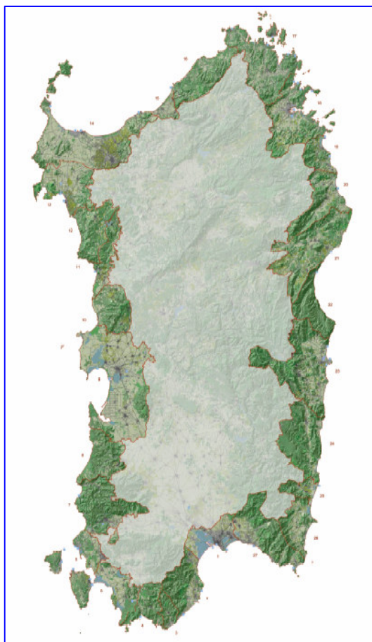
Fig 1: Aree costiere disciplinate dal PPR

L'approccio verso i processi di trasformazione del territorio è innovativo rispetto al passato: si assume il principio di tutela del paesaggio fon-